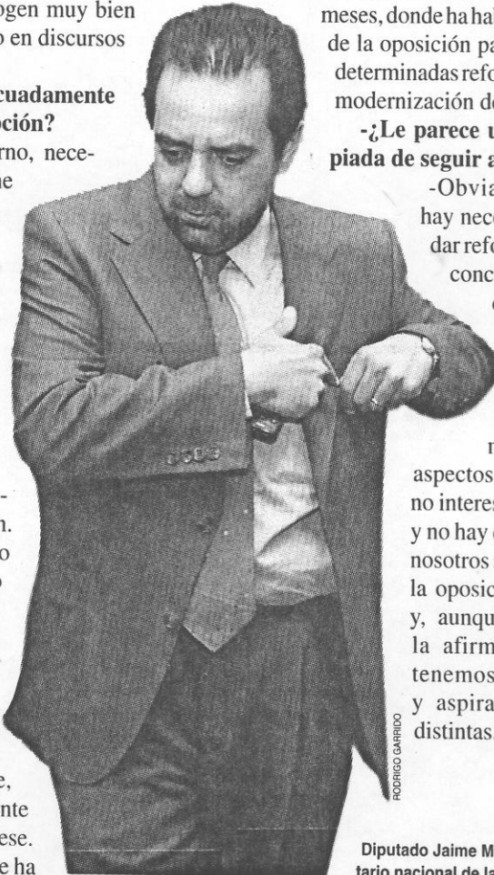
Diputado Jaime Mulet, secretario nacional de la DC.

Pero, obviamente, hay otros aspectos que claramente no interesan a la oposición y no hay que olvidarse que nosotros somos gobierno y la oposición es oposición y, aunque parezca obvia la afirmación, nosotros tenemos características y aspiraciones políticas distintas.