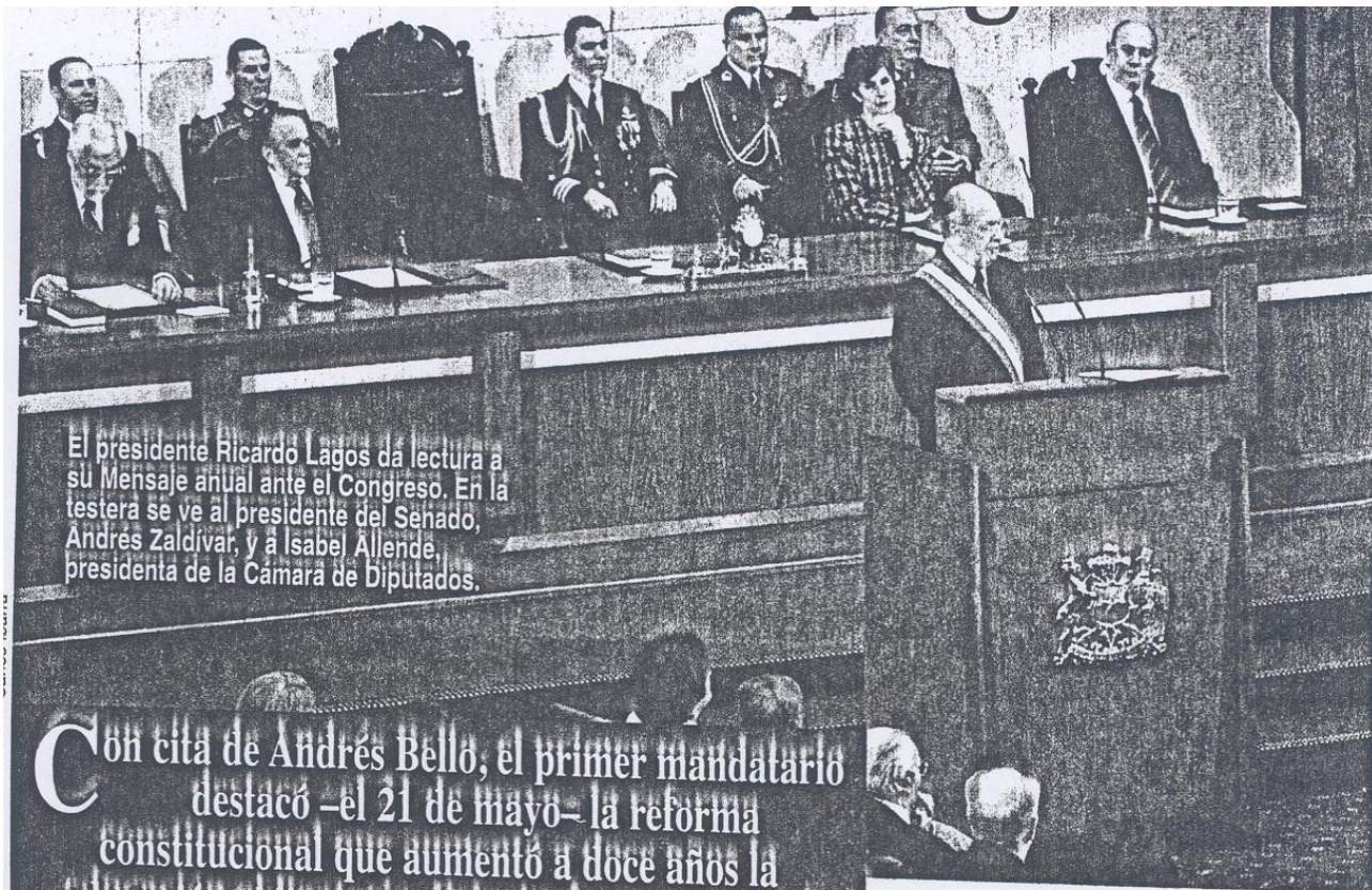
El presidente Ricardo Lagos da lectura a su Mensaje anual ante el Congreso. En la testera se ve al presidente del Senado, Andrés Zaldívar, y a Isabel Allende, presidenta de la Cámara de Diputados.