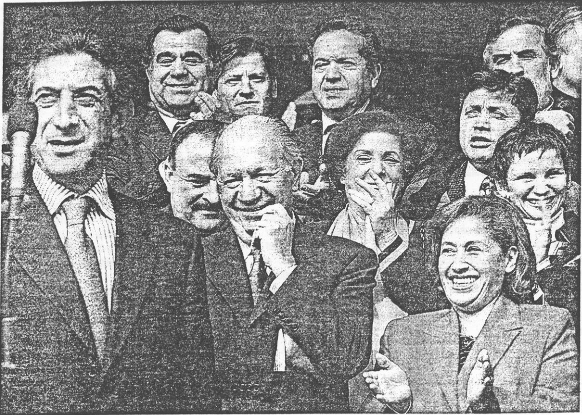
Diputados con Lagos: parlamentarios de todos los partidos se reunieron el jueves con el Presidente en medio de un ambiente de euforia post 21 de mayo. La cita fue considerada una potente señal de unidad oficialista.